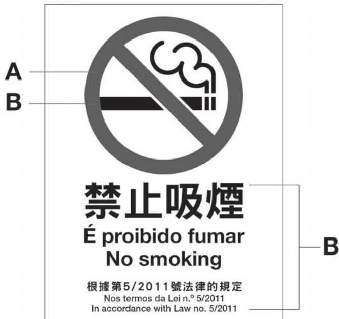
式樣一 Modelo I