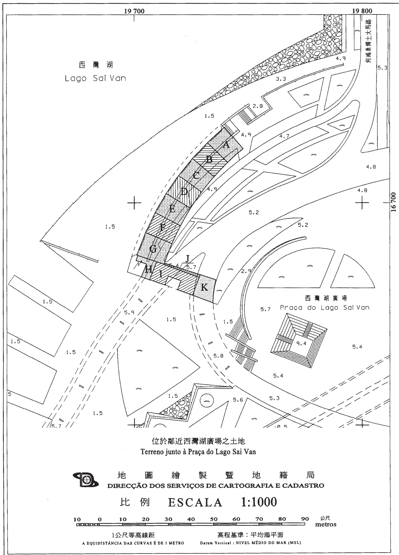
位於鄰近西灣湖廣場之土地 Terreno junto à Praça do Lago Sai Van