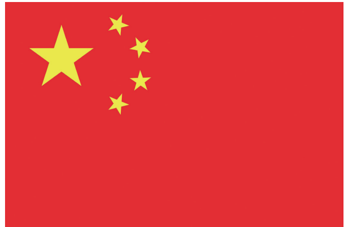
Resolução de 4096 x 2730