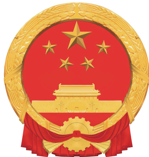
Resolução de 1024 x 1024