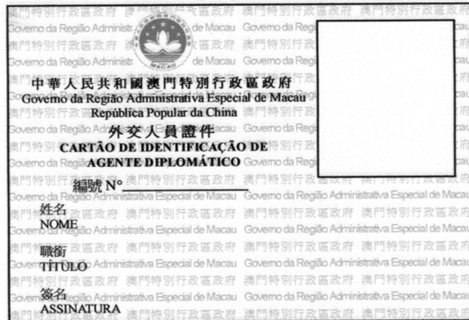
外交人員證件——背面 Cartão de Identificação de Agente Diplomático — Verso