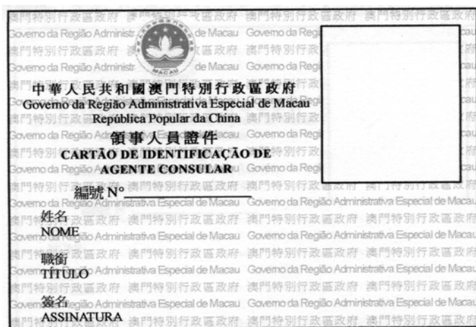
領事人員證件——正面 Cartão de Identificação de Agente Consular — Frente